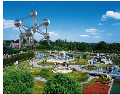
Hareketlilik projelerinde yoğunca ziyaret edilen mekânlardan Atomium, 1958 yılında Expo 58 fuarı için yapılmış Belçika'nın Brüksel şehrinde bulunan anıt binadır.

Hayatboyu Öğrenme Programı, ilk ve orta öğrenimdeki öğrencilerimizden yetişkinlere, mesleki eğitim stajyerlerinden üniversite öğrencilerine, temel beceri ihtiyacı duyan insanlardan eğitim profesyonellerine kadar herkes için eğitim ve öğretimde gelişme imkânları ve karşılıksız mali katkı sağlayacaktır. Aşağıdaki tablo, Programlara ilişkin yalnızca temel bilgi verme amacını taşımaktadır. Gerek her bir alt programın (sektörel programların) gerekse bunlar içindeki diğer alt faaliyetlerin hedef kitleleri, teklif çağrıları, başvuru koşulları ve tarihleri, proje kalite değerlendirme kriterleri ve hibe miktarları konusunda en güncel bilgiler için lütfen Avrupa Birliği Eğitim ve Gençlik Programları Merkez Başkanlığı web sitesini ( www.ua.gov.tr ) takip ediniz.