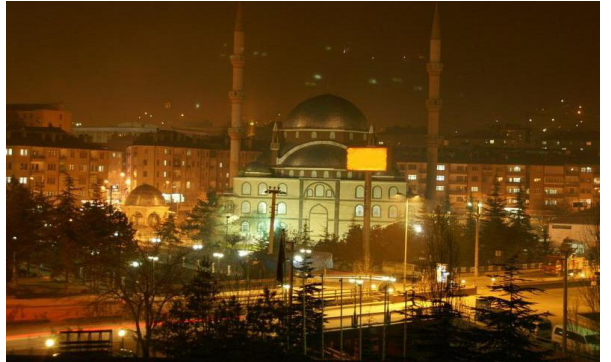
Polonyalı öğretmenin objektifinden Çankırı Ahmet Yesevi Camii