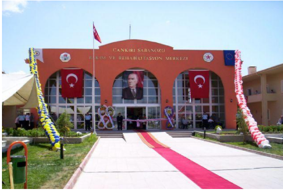
Şabanözü Bakım ve Rehabilitasyon Merkezi (AB Hibe Miktarı(2006-2007): 1.694.541,09 €)