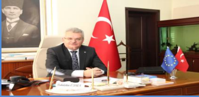
Vahdettin ÖZCAN Çankırı Valisi

Bugün, Avrupa bütünleşmesi fikrinin tohumlarını atan 9 Mayıs 1950 tarihli Schuman Deklarasyonunun yıldönümünü kutlamaktayız.