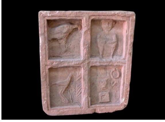
Helenistik Dönem Mezar Steli, Çankırı Müzesi.

İşte böyle bir siyasi ortamda gelişen Çankırı'nın Helenistik ve Erken Roma Dönemi'ne ait 11 adet yerleşim ve Nekropol alanı tespit edilmiştir. Antik kaynaklarda adı geçen üç adet yerleşim yerinin lokalizasyonu yapılmıştır. Bunlar; Gangra Kalesi (Çankırı Kalesi), Kimiatene Şehri (Kurmalar Antik Yerleşimi) ve Antoniopolis (Aydınlar köyü ve civarı)'dır. Ayrıca 1966-67 yıllarında Anadolu Medeniyetleri Müzesince gerçekleştirilen kurtarma kazılarında Terme Höyük'te Helenistik dönem bir yapı katı tespit edilirken, Höyüğün güney ve batısında yer alan üç adet Helenistik Dönem tümülüslerinin de kurtarma kazıları yapılmıştır 13 .