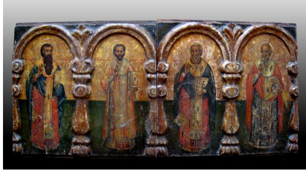
Azizler, İkona Çankırı Müzesi.

Gangra'da düzenlenmiştir. Bu defa Pompeiopolis, Amastris gibi şehirler Gangra'ya bağlanmıştır. Bizans edebiyatında, hem Konsillerin piskopos listelerinde, hem de bir kaç azizin hayatında Gangra'dan sıklıkla bahsedilmektedir 15 .