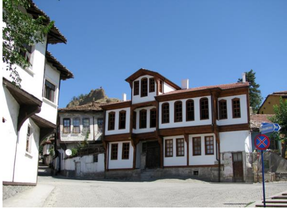
Merkez 13 Nolu Konak

Şehrin eski iskân alanında evlerin esas cepheleri arazi yapısına uygun olarak güneye bakmaktadır. Kuzey yüzleri kapalıdır. Esas cephelerin güneşten ve yamaç manzarasından faydalanması açık sofalı evlerin inşasına olanak vermiştir. Evlerin en eski örnekleri açık sofalı plan tipindedir 25 .