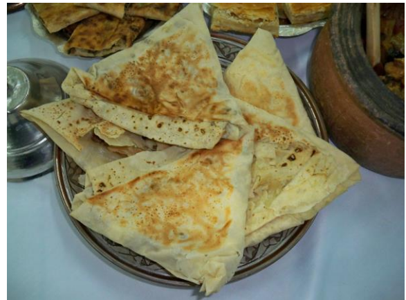
İnce Ekmek Muskası