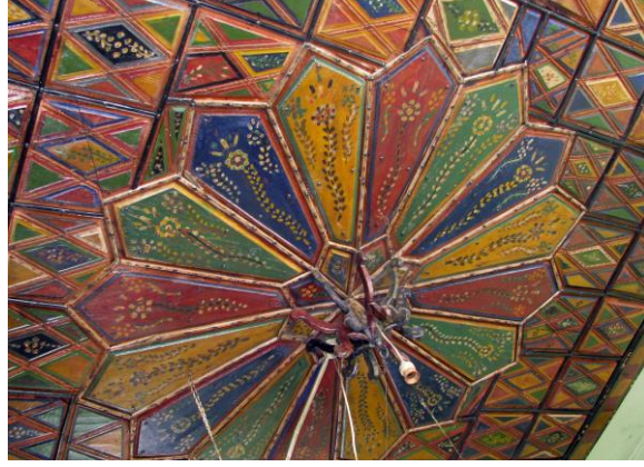
Merkez 45 Nolu Konut, Ahşap Tavan Süslemesi.

yapıların tavanlarında, merdiven korkuluklarında, kapılarında, çıkma pervazlarında, şerbetlik ve dolaplarında çeşitli süslemeler yapılarak kullanılmıştır 27 . Oda ocaklıkları yuvarlak kemerli sade yapıldığı gibi üst yapısı kemerli sığ bir niş ve alçı işi şerbetlikli olarak ta değerlendirilmiştir. Duvar yüzeyleri toprak ve alçı sıva üstüne çoğunlukla beyaz badanalıdır.