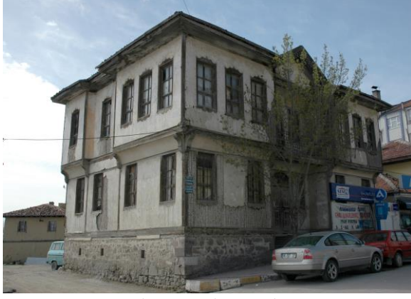
Ilgaz 1 Nolu Konak