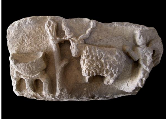
Sunak Önünde Tiftik Keçisi ve Melek, Roma Dönemi Çankırı Müzesi.

Gangra sözcüğünün dişil olduğunu söyledikten sonra efsaneyi özetle şu şekilde anlatmaktadır: “Poseidon’la Aryes’in çocuğu olduğunu söyleyen Nikostratos Paflagonya çevresinde keçilerini otlatmak için bir otlak arar ve sonunda uygun bir yer bulur ve bu geçit vermeyen dağların çobanı, toprak sahibiyle anlaşır. Keçilerini otlatırken arazisine de göz kulak olacağını söyler... Bir gün yüksekçe bir tepe üzerinden çevreyi gözlerken dimdik yükselen fakat öbür tarafa geçit veren bir kayalık görür ve o sırada aşağıda oğlakların melediğini işitir. Orada doğurmuş olan keçiyle yavrusunu taşıyarak geçitten geçip, gördüğü elverişli arazi üstüne bir şehir kurar ve oğlağa taktığı Gangra adını şehre de verir” 1 .