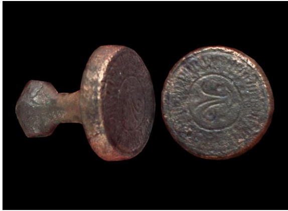
Çekiç Başlı Bronz Mühür, Eski Hitit Çağı, Çankırı Müzesi.

Orta Tunç Çağı; Asur Ticaret Kolonileri ve Eski Hitit Krallığı zamanı olup bu iki dönem sırasıyla Kayseri yakınlarındaki Kültepe-Kaneş ve Boğazköy-Hattuşa kazıları ile tanınmaktadır. Çankırı, Orta Tunç Çağı'nda önemli yerleşimlere sahne olmuştur. İl sınırları içerisinde yapılan araştırmalarda bugüne kadar 35 adet Orta Tunç Çağı'na ait höyük ve nekropol olanı tespit edilmiştir. Bunların çoğunluğunda M.Ö. 2. binin ortalarına yani Eski Hitit Krallık Dönemine (M.Ö. 1650-1450) tarihlenen arkeolojik malzemeler bulunmaktadır. Özellikle bir kült kenti olan İnandık arkeolojik ve filolojik buluntularıyla bu dönemin en önemli şehirlerinden birisidir 6 .