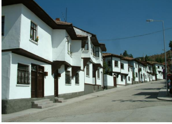
Merkez Su Deposu Caddesi, Korunacak Sokak

çıkma yapan örnekler dışında taş ve tuğla duvarlı farklı bir yapıda koruma altına alınmıştır. Eldivan, Saray köyde bulunan Paşa Konağı ile Korgun ilçe merkezinde bulunan Sipahi Konağı Cihannüma işlevi gören üst kat birimleri ile farklılık oluşturan başka yapılarıdır.