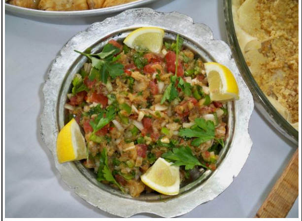
Gömme (Patlıcan Salatası)