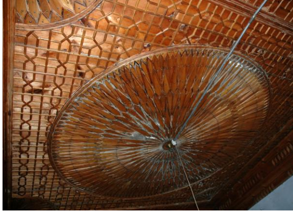
Baş oda ahşap tavan süslemesi, Çerkeş.