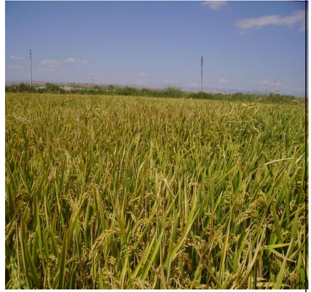
Kızılırmak Çeltik (Pirinç)