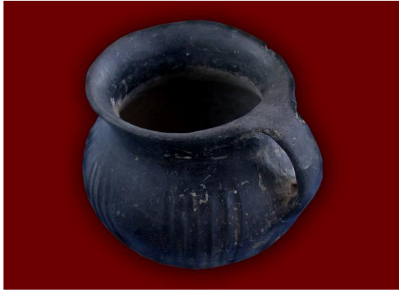
Eski Tunç Çağı III dönemi kabı, Çankırı Müzesi.

Kalkolitik dönemi takip eden Eski Tunç Çağı'nın yerleşimcileri Anadolu'nun yerli halkları olan Luviler ve Hattilerdir. Eski Tunç Çağı'nda, bölgedeki doğal kaynakların yakınına kurulmuş yerleşimlerin ve bunlara ait mezarlıkların sayısında önemli bir artış başlamıştır. Bu doğal kaynaklar temiz su, verimli tarım arazileri ve otlaklar ile endüstriyel kaynaklardır. Endüstriyel kaynakların başında kaya tuzu gelmektedir. İkinci olarak özellikle Neolitik ve Kalkolitik Çağ'da büyük öneme haiz olan çakmak taşı ve obsidiyendir. Kalkolitik ve Eski Tunç Çağı sakinlerinin büyük olasılıkla bölgede başta kaya tuzu, çakmak taşı ve obsidiyen gibi ürünlerin ticaretini yaptıkları düşünülmektedir 4 . Salur Höyük yakınında tespit edilen obsidiyen yatakları ve günümüzde hala işletilen Tuz Mağarası yakınındaki Sariçi Höyük bunlara güzel birer örnektir.