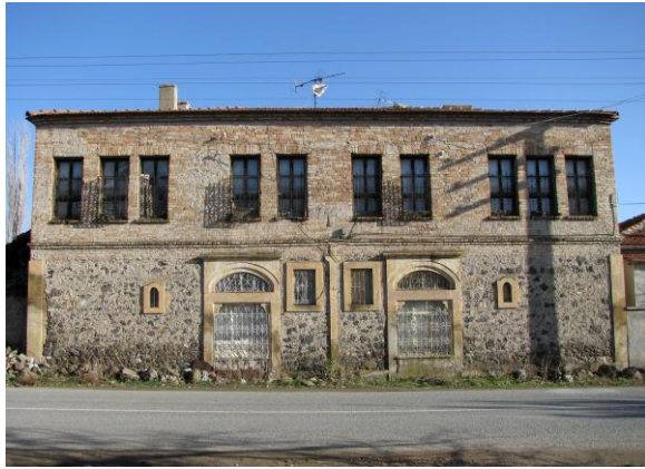
Çerkeş Taş ve Tuğla Duvarlı Konak