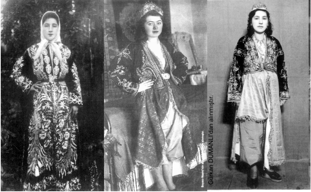
Çankırı Yöresi Bayan Giysilerinden Örnekler

Gelin tarafının çeyizi, oğlan tarafının hazırladığı çeyizle aynı kıymette olurdu. Her iki tarafın çeyizlerinin yüklenmesi için 20-30 kadar katır hazırlanırdı.